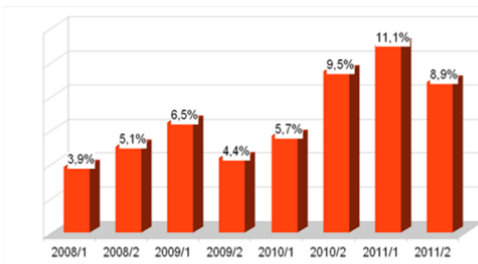
Gráfico 1 - Evasão nos Cursos de Graduação da UFVJM, no período de 2008 a 2011.

Com a aplicação dessa norma aqueles estudantes que não renovaram suas matrículas ou não optaram pelo trancamento foram automaticamente desligados da Instituição, ocasionando um aumento significativo do número de desistências/evasão no período estudado. O fato desse procedimento não ser adotado anteriormente à implantação do Regulamento dos Cursos, concorria para que muitos estudantes que não tinham interesse em retornar para a UFVJM deixassem sua vaga “presa”, prejudicando o processo de ocupação de vagas ociosas, pela impossibilidade da Instituição disponibilizar essas vagas para os processos de transferência, reopção de cursos e obtenção de novo título.