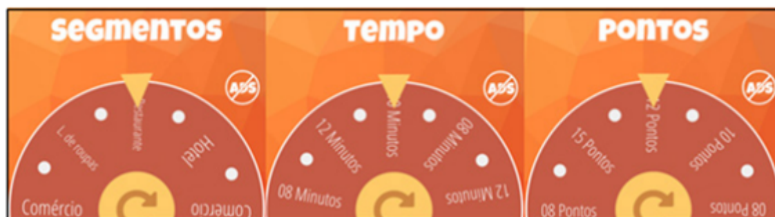
Figura 2. Telas do jogo para o sorteio de segmentos, tempo e pontuação

A execução do game dividiu a turma em quatro grupos e utilizando o aplicativo móvel Decision roulette 1 se procedeu a escolha sobre os segmentos de negócios, tempo para a entrega de cada fase do jogo e a pontuação que cada equipe conquistaria.