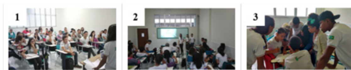
Figura 3. Momentos da apresentação do seminário e do game

Através de todos os processos realizados se analisou a absorção e expressão dos conteúdos, além da interação e a motivação entre os estudantes. Na figura 3, são retratados os momentos do estudo, iniciados com o seminário sobre a inovação no ensino e aprendizagem em administração (1), seguido da apresentação dos enunciados do jogo (2) e os sorteios existente nas fases (3).